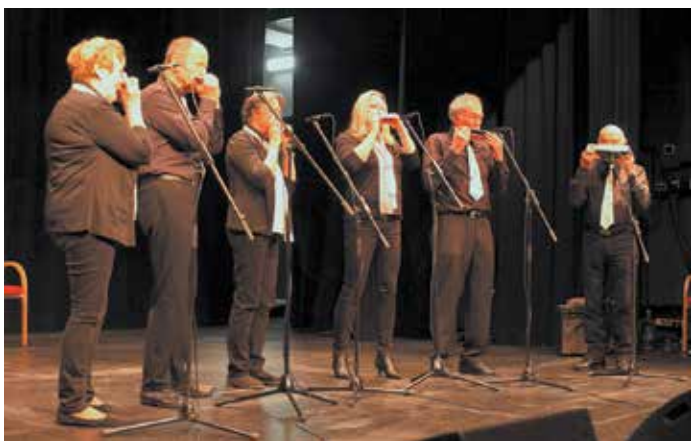
Ansambel z Vrbskega jezera