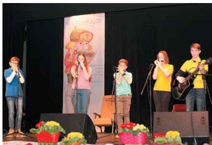
Podmladek sorških orgličarjev