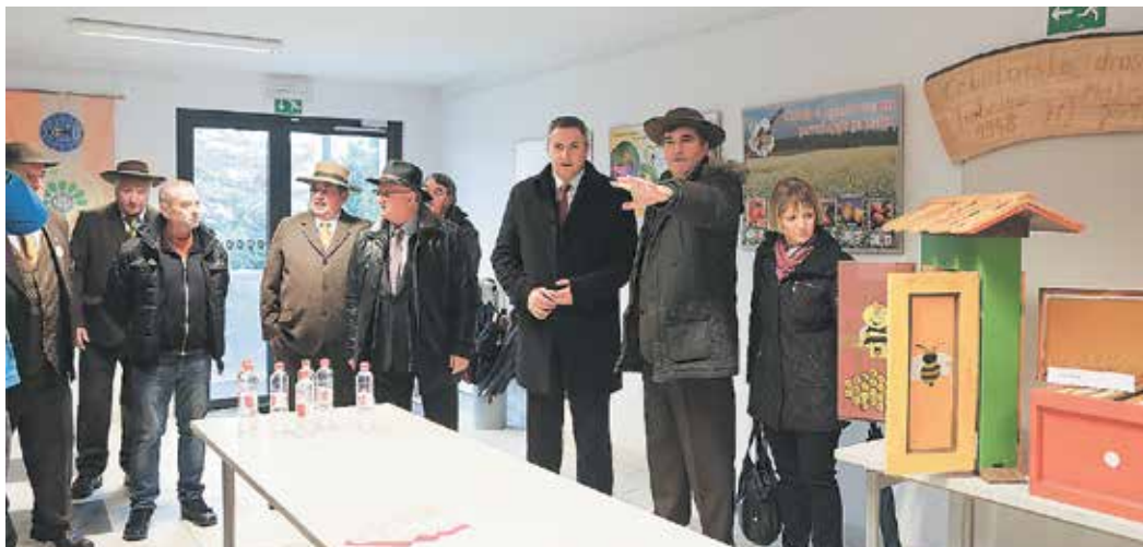
Na ogledu razstave