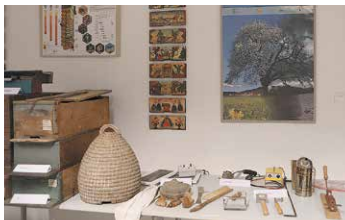
Izsek z razstave