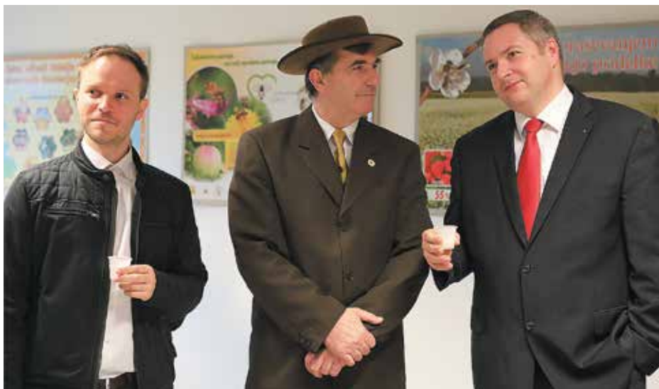
In kaj pravite o medički, gospod minister.