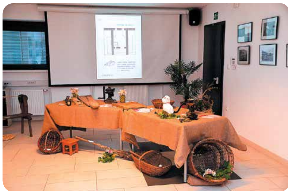
Razstava v avli upravno-kulturnega središča.