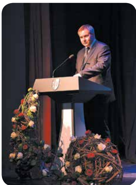
mag. Dejan Židan, minister za kmetijstvo, gozdarstvo in prehrano.

Občina je na praznični dan dobila prenovljeno spletno mesto, v avli upravno-kulturnega središča pa so si obiskovalci ogledali fotografije s podobami občine in razstavo strega kmečkega orodja, ki so ga za to priložnost prinesli domačini z Loga in iz