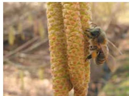
Leska – medoviti grm, ki nas jeseni razveseljuje s svojimi plodovi – lešniki.

S tem nahranimo milijone drobnih organizmov v tleh in izboljšamo zračnost in strukturo tal. Tako s tem ravnanjem zemljo obogatimo. Rastline, ki jih nato posejemo na to zemljo bodo bolj močne, zdrave in tudi odporne na stres, ki je v zadnjem času bolj pogost. To mislimo na neugodne