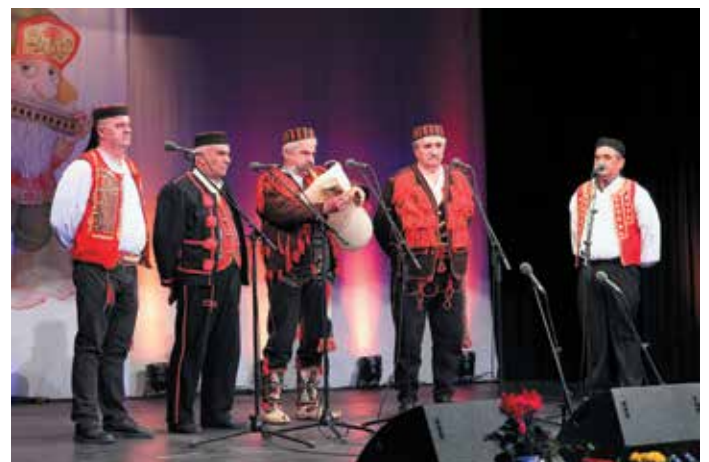
Zvuci zavičaja iz Zadra