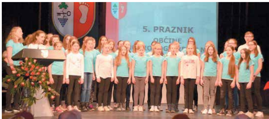
OPZ OŠ Mokronog

Župan Anton Maver pa se je ozrl na največje uspehe prete-