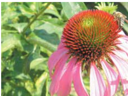
Ena od medovitih rastlin je ameriški slamnik.

V cvetlična korita na balkonu imamo številne možnosti pri izbiri medovitih rastlin tako iz vrst začimbnic in dišavnic. V korita lahko sadimo baziliko, origano, timijan, meliso, boreč kot tudi nizko sočnico ali ameriški slamnik in še bi lahko naštevali. Če imamo veliko prostora na vrtu se lahko odločimo za zasaditev medovitih dreves kot so lipa, divja češnja, navadna leska, kostanj