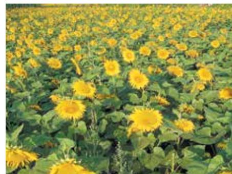
Polje sočnic, ki čebelarom zagotavljajo medicino in cvetni prah.

vremenske pogoje in tudi posledično na bolezni in škodljivce. Na javnih površinah (parki, vrtovi, ...) imamo tudi možnost, da izberemo avtohtone medovite rastline. Med njimi so to lipa, kostanj, javor kot tudi številne medovite trajnice in grmičevje. S tem pozitivni delom ne bomo omogočili le pašo čebelarom, ampak bomo poskrbeli tudi za našo okolico. Ne le čebele, ampak tudi narava nam bo hvaležna, saj ji bomo vračali tisto kar potrebuje, da skupaj ohranimo naš prostor za prihodnje rodove.