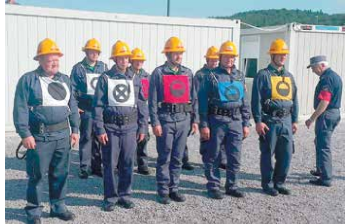
Člani B odlično 1. mesto na tekmovanju GZT