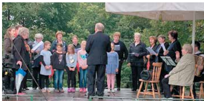
Šolarke in ŽePZ Zimzelen Mirna