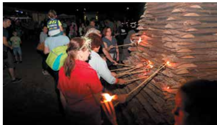
Prižig kresa z baklami