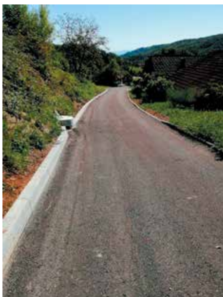
Sv. Vrh - Brezovec