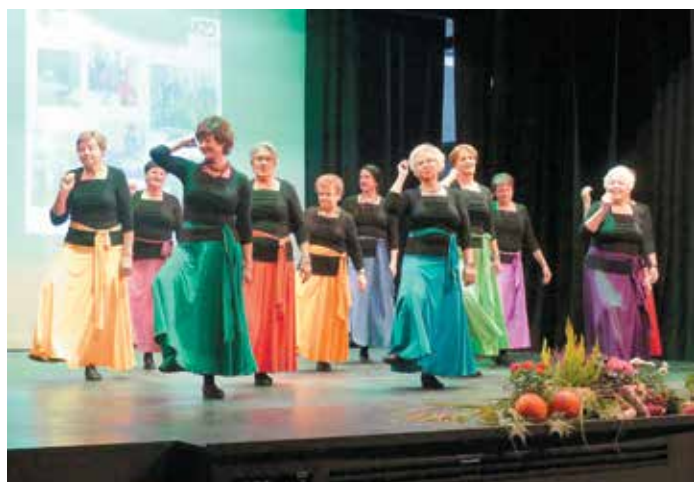
Otvoritev UTŽO 2018, arhiv CIK Trebnje

Jesen že počasi trka na naša vrata in oznanja, da smo že zakorakali v novo šolsko leto in tako napoveduje pestro dogajanje na našem centru.