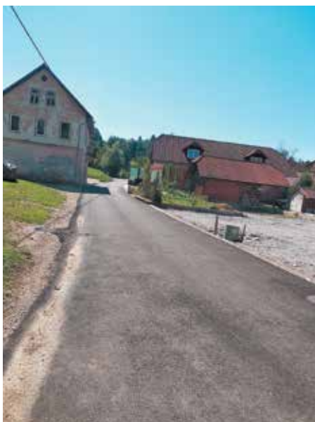
Pod Gradom – Frenja