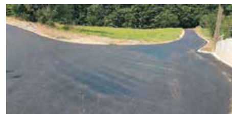
Dolenje Zabukovje – Suho Brezje

in obnovo prometne signalizacije. Hkrati z obnovo navedenih odsekov je izvajalec asfaltiral tudi cesto v Čilpahu, in sicer na odseku kjer smo lani gradili javni vodovod. Z usklajenostjo oz. sodelovanjem med izvajalci del, uporabniki cest in neposredno tam živečimi občani, je izvedba del na vseh odsekih potekala brez večjih zapletov.