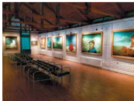
Utrinek iz Galerije naivne umetnosti, Hlebine

Oktobra pa bomo v galeriji gostili novo razstavo , ki nastaja v sodelovanju z Muze-