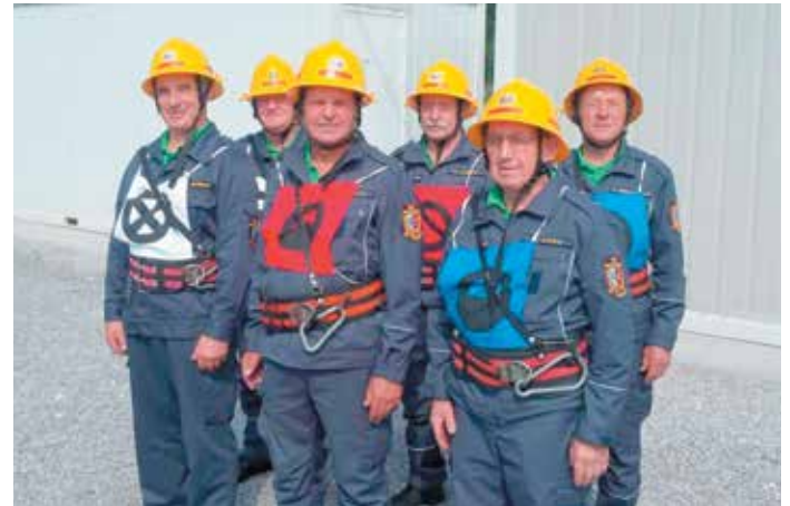
Starejši gasilci odlično 2. mesto na tekmovanju GZT

31.8. Regijsko tekmovanje v gasilski orientaciji: mladinci (2. mesto)