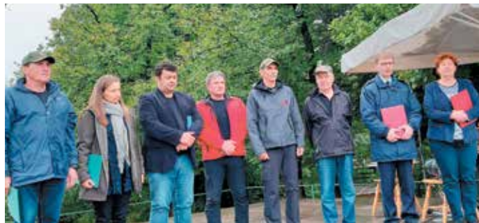
Prejemniki priznanj in podeljevalci

presojeti, nikakor pa na podlagi dnevno-političnih koreografij. Tega ne smemo dopustiti!“