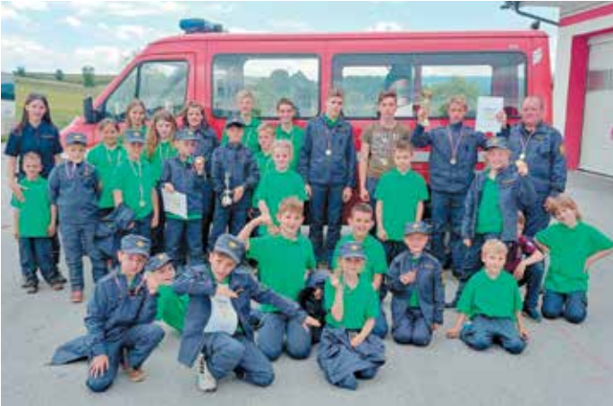
Odlični 1. pionirji in mladinci na tekmovanju Gasilske zveze Trebnje.