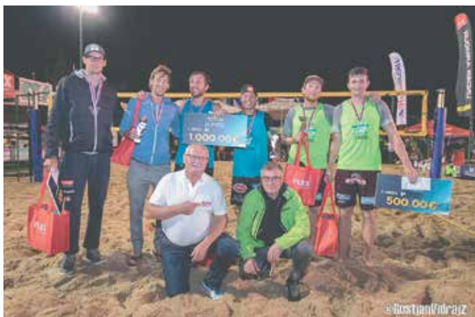
Zmagovalci med moškimi