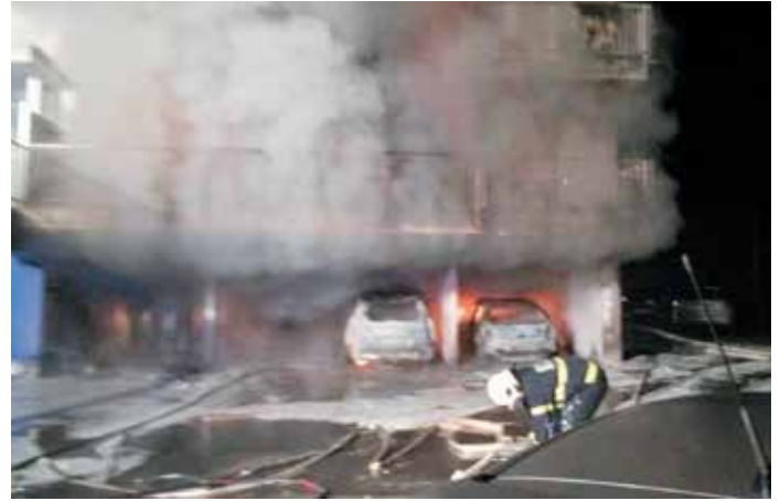
Požar Levji dvori v Trebnjem

Nosilna tematika letošnjega meseca varstva pred požari je namenjena Požarni varnosti v večstanovanjskih objektih . V Sloveniji je 10.045 večstanovanjskih objektov z več kot 8 stanovanji v enem objektu, v teh objektih pa je skupaj 261.397 stanovanj. Vsakodnevna praksa nam kaže, da so stanovalci v večstanovanjskih objektih še vedno premalo osveščeni in poučeni o požarni varnosti v njihovih stanovanjih in objektih.