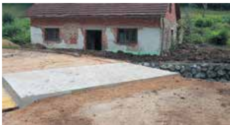
Most_Pugled pri Mokronogu

V poletnem času je bilo na območju Občine Mokronog-Trebelno obnovljenih 5 odsekov občinskih cest, in sicer Pod Gradom – Frenja, Sv. Vrh – Brezovec, Bogneča vas, Dolenje Zabukovje – Suho Brezje ter Florijanska cesta. Dela na posameznih odsekih so obsegala zamenjavo spodnjega ustroja ceste, izvedbo asfaltne plasti, obnovo in ureditev odvodnjavanja, ureditev bankin