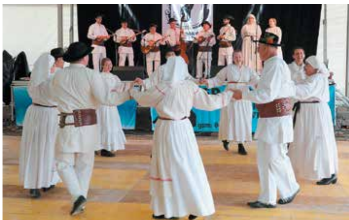
Predstavitve folklorne skupine Kres