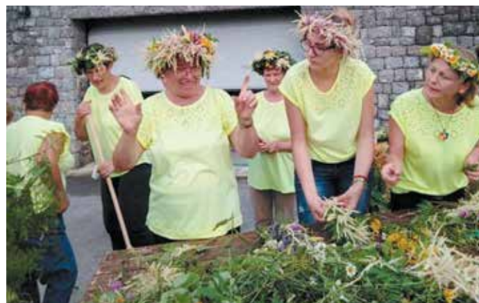
Delavnica pletenja venčkov

Že od nekdaj je Kresna noč veljala za čarobno. Po ljudskem izročilu so takrat imele rastline in voda posebno moč, tradicionalno pa so v tej noči zagoreli tudi kresovi. Da bi v Mokronogu obudili, kar so nekdaj doživljali ob kresnih nočeh, so v Mokronogu zasnovali prireditev, s katero si prizadevajo ohranjati bogato kulturno dediščino. Kljub temu, da vreme dogodku ni bilo ravno naklonjeno, so vseeno uspešno izpeljali tokrat že 30. tradicionalno prireditev, katere začetki segajo v leto 1973.