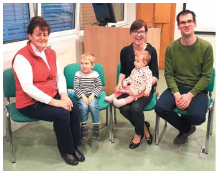
Družina Kralj z medicinsko sestro Gačnik