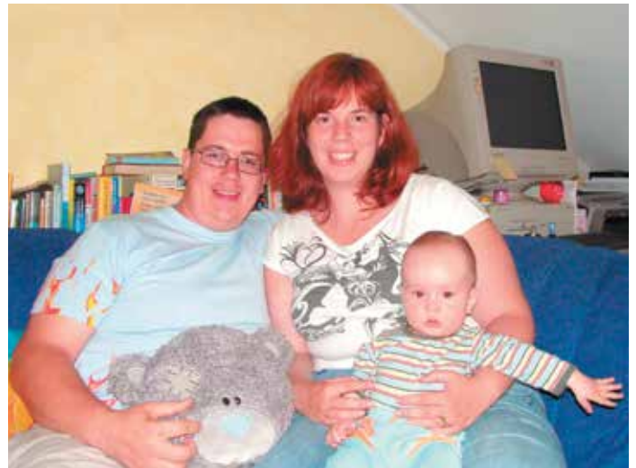
Družina Šinkovec Sila