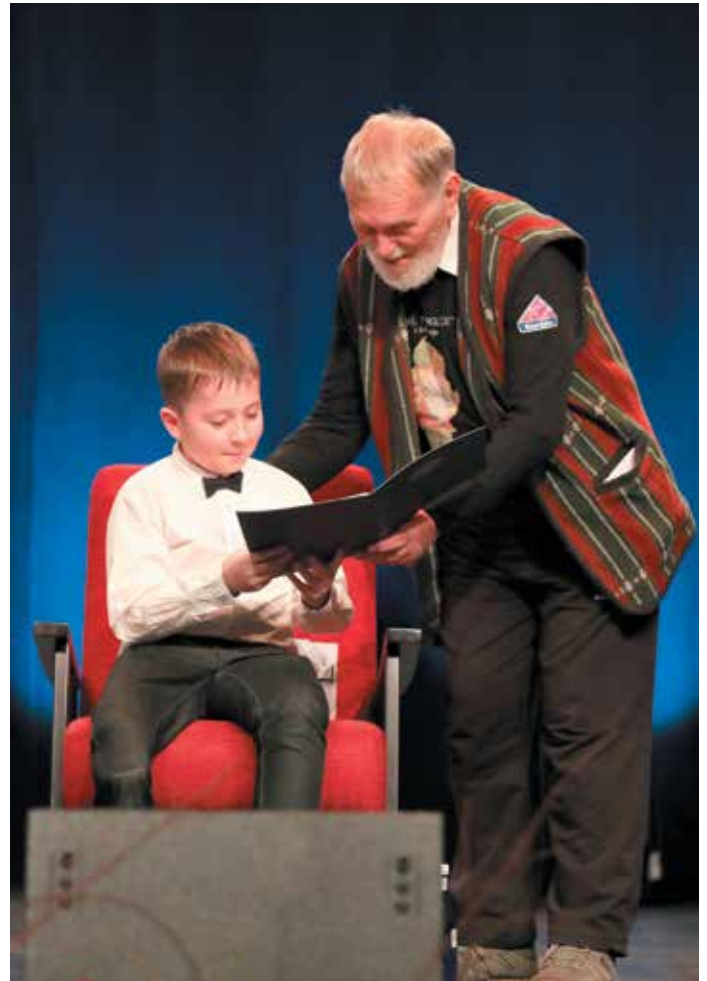
Razglasitev najbolj simpatičnega orgličarja