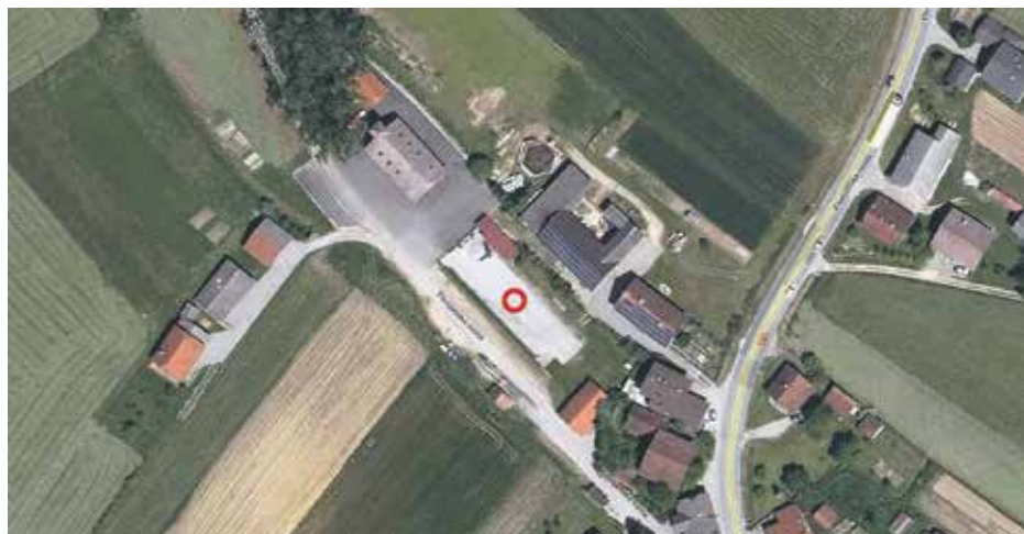
Obstoječe stanje na Ortofoto posnetku

Projekt je prijavljen v okviru razpisa LAS sodelovanja v katerem sodeluje 7 slovenskih LASov in 11 občin. Odločitev o uspešnosti prijave s strani Agencije za kmetijske trge pričakujemo v mesecu juniju.