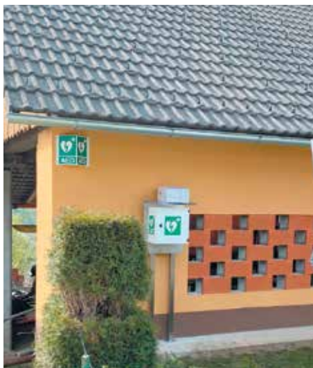
AED Mirna vas, Trebelno (pri Stanku Piškurju)