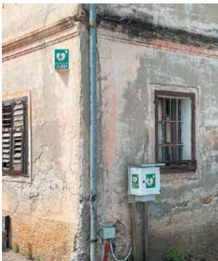
AED Srednje Laknice, Mokronog (pri Alojziji Vovk)

V okviru projekta se je izvedlo tudi izobraževanje iz Temeljnega postopka oživljanja z uporabo AED aparatov ter razširjeni tečaj, ki je bil prvenstveno namenjen