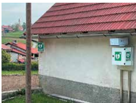
AED Sveti Vrh, Mokronog (pri Dragu Kastelicu)

prvim posredovalcem. Izobraževanja so se izvedla v organizaciji Območnega združenja Rdečega križa Trebnje.