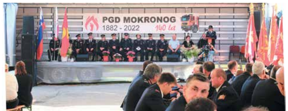
Svečani del praznovanja pred gasilskim domom