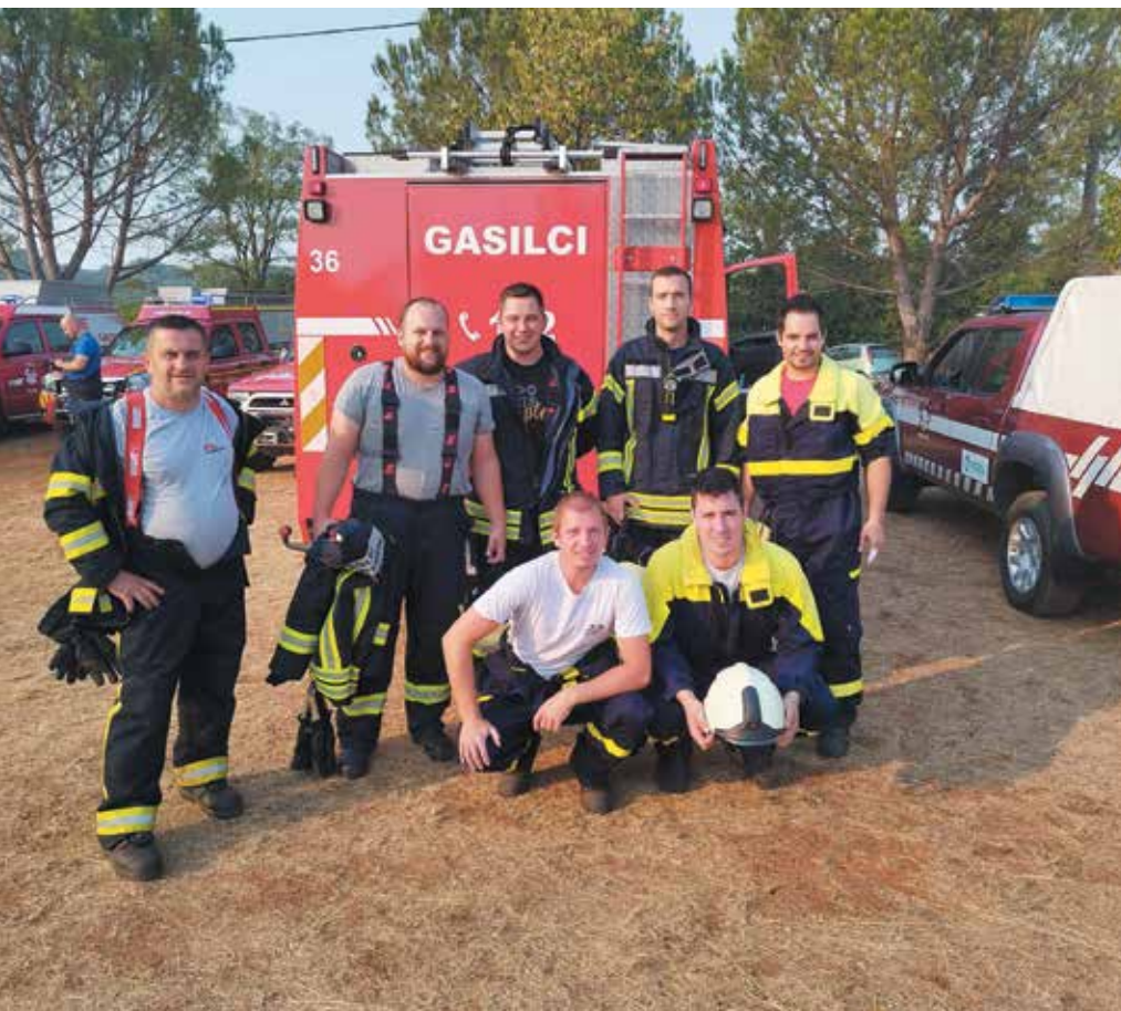
Ekipa PGD Štatenberk s članom PGD Velika Strmica

je polno še neaktiviranih bojnih sredstev iz časov vojne in ta so podlegla ognjenim zubljem ter eksplodirala, s tem pa predstavljala še dodatno nevarnost in težavo za gasilce.