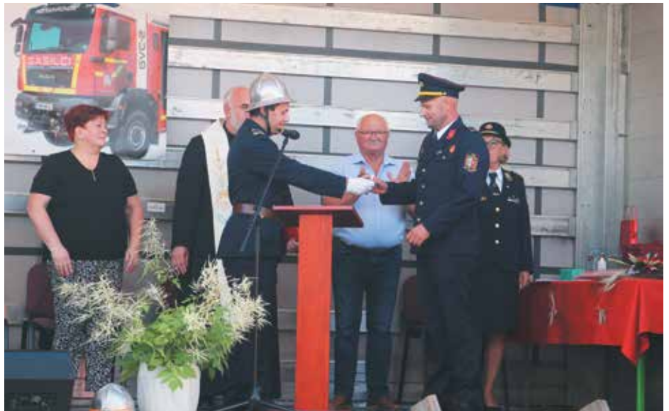
Slavnostna predaja ključev