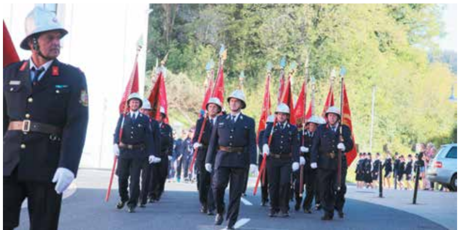
Ešalon gasilcev skozi trško jedro