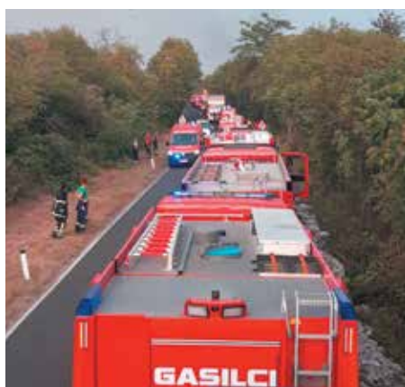
Prihod izmene konvoja vozil GRD in srečevanje z enotami nočne izmene.

požarišča. Do požarnih preskokov ni prišlo. Planirana je bila že četrta odprava GRD z večjimi vozili, ko se je požar umiril do te mere, da so iz štaba sporočili zgolj potrebo po manjših gasilskih vozilih za gašenje gozdnih požarov (GVGP-1). V našem GPO s takim vozilom razpolaga zgolj PGD Trebelno, ki je nato izmenoma s petimi gasilci posredovalo, opravljalo ogleda in gasilo manjše začetne požare od 26. do 28. julija.