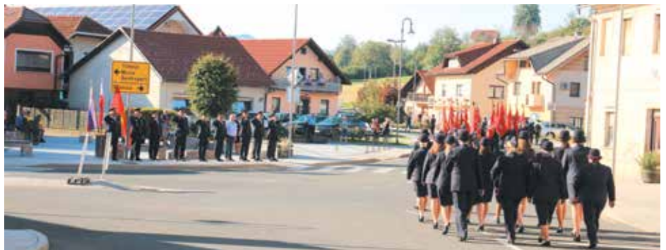
Mimohod gasilcev mimo častne tribune