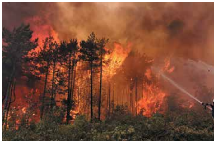
Preprečevanje požarnega preskoka z aktivnim gašenjem požarnega roba. Spodaj je vidna protipožarna preseka.

Tretja odprava društev GPO Mokronog-Trebelno je bila v nočno izmeno 23. julija 2022, in sicer na območje Miren z okolico. Posredovale so enote PGD Trebelno z vozili AC 16/40, GV-1 ter osmimi gasilci, PGD Sveti Križ z vozilom GVV-1 in petimi gasilci, pridružil pa se jim je še gasilec iz PGD Štatenberk. Zaradi zagotavljanja vsaj dveh gasilskih cistern v občini je PGD Mokronog z vozili GVC 16/25 in GVC-2 ostal doma v pripravljenosti. Vremenske razmere so se ponoči znova umirile, zato so enote v obliki patrolj izvajale ogleda ter gasile manjša