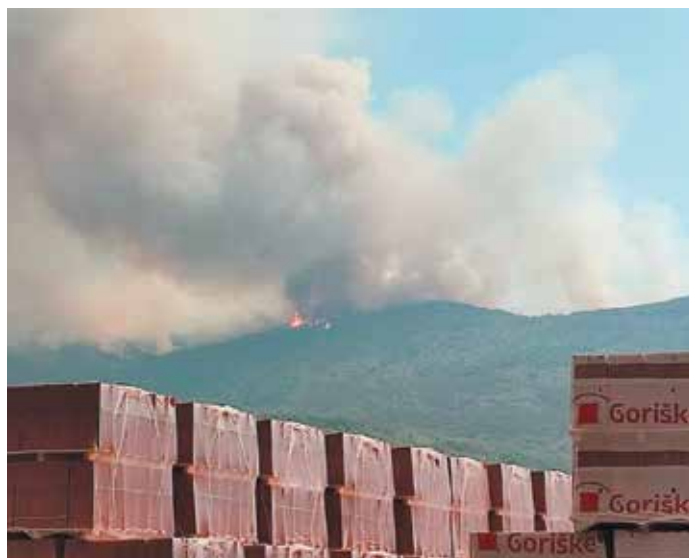
Požar na Trstenjaku od daleč