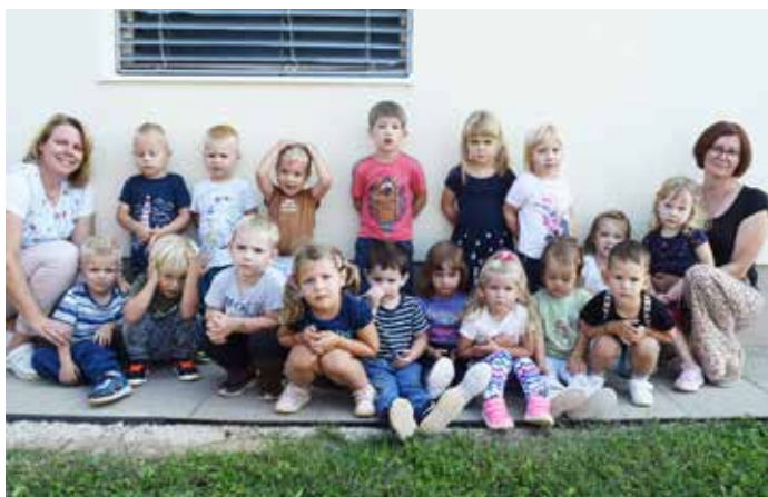
skupina METULJČKI (2)