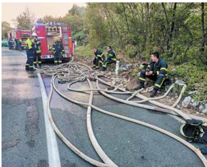
V pripravljenosti.