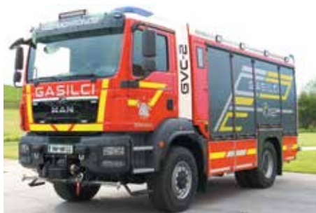
Novo gasilsko vozilo GVC-2

so sodelovali številni gasilci, gasilke in gasilska mladina, predstavila pa so se tudi tipična gasilska vozila. Na prireditvenem prostoru pred gasilskim domom so sledili pozdravi gostom, slavnosti govori, podelitve priznanj in odlikovanj ter kulturni program.