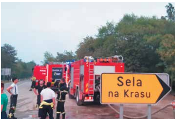
Polnjenje gasilskih cistern z vodo za gašenje.