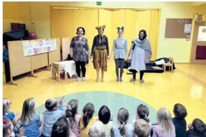
Gledališka predstava Lahko noč za medveda